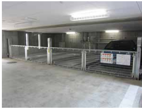
地下2段地上1段昇降横行式