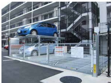
格納ゲート付き 地下1段地上1段昇降式 地下2段地上1段昇降式