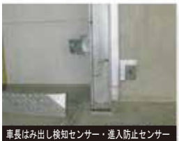
車長はみ出し検知センサー・進入防止センサー

安全面を最大限に考慮し、使い易さにも配慮した製品設計です。オプションにてお客様各々のニーズに合った製品をご提供させて頂きます。