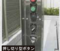
押し切り型ボタン