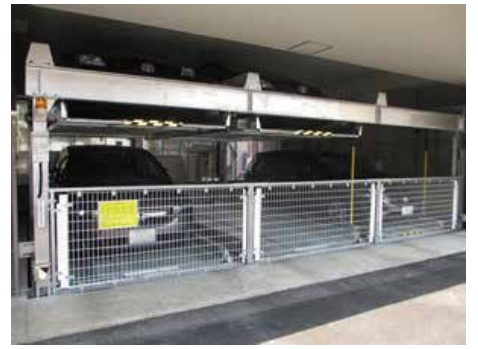
地下2段地上2段昇降横行式