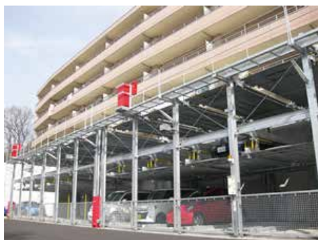
地上3段昇降横行式