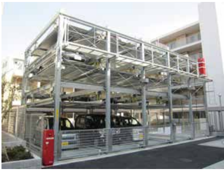
地下1段地上4段昇降横行式