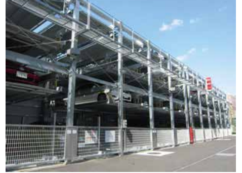
地下2段地上4段昇降横行式