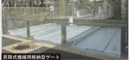
昇降式機械用格納型ゲート