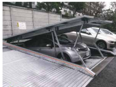
地下1段地上1段昇降式 (油圧式)