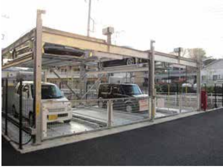
地下2段地上2段昇降横行式