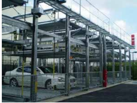
地下2段地上3段昇降横行式