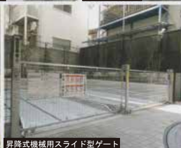
昇降式機械用スライド型ゲート