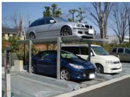
地下1段地上1段昇降式