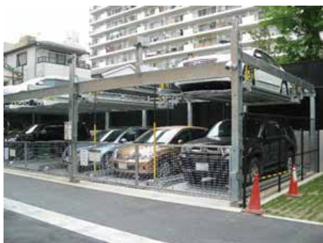
地上2段昇降横行式