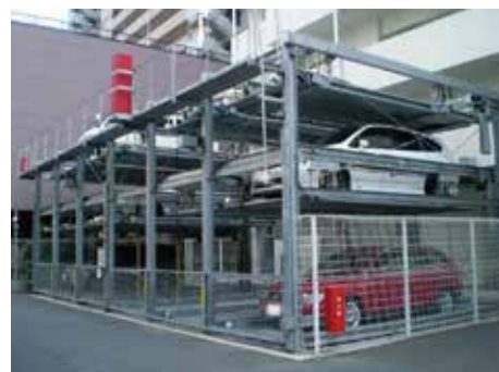
地下1段地上3段昇降横行式