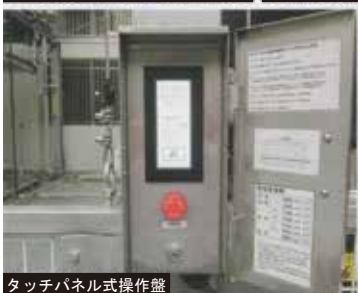
タッチパネル式操作盤