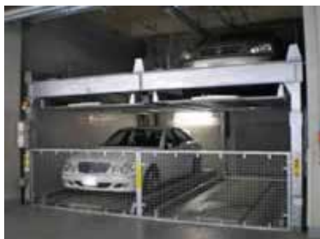
地下1段地上2段昇降横行式