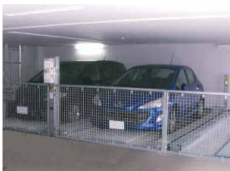
地下1段地上1段昇降横行式