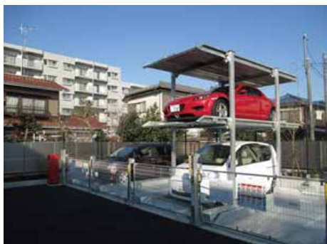
スライドゲート付き 地下1段地上1段昇降式 地下2段地上1段昇降式