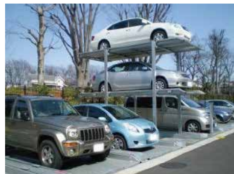
地下2段地上1段昇降式