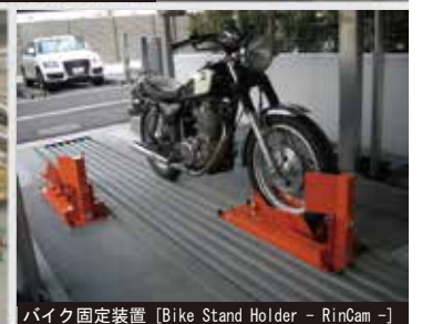
バイク固定装置 [Bike Stand Holder - RinCam -]