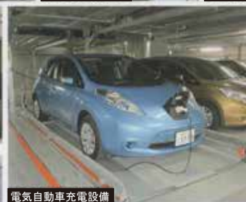
電気自動車充電設備