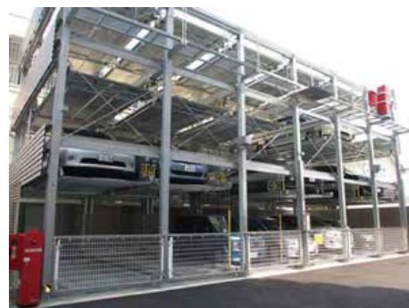
地上4段昇降横行式